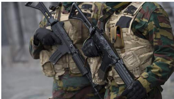
Militaires dans les rues de Bruxelles (archives) © photo news.

Au cours de l'année écoulée, la menace terroriste a augmenté en Belgique et dans huit autres pays occidentaux. La Belgique figure par ailleurs à la 12e place des pays d'où partent le plus de candidats au djihad, avec 440 ressortissants ayant rejoint la Syrie depuis avril 2014.