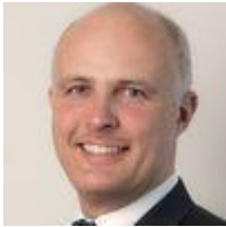
Frederic Debusseré Advocaat van de Privacycommissie